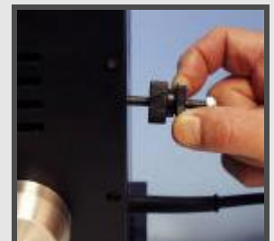
Vis avec arrêt pour contrôler la quantité de colle par pastille