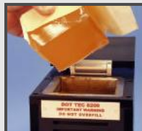
Rechargement facile de blocs de colle PEEL-TEC de 500 g