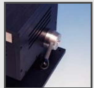
Livré en standard avec témoin lumineux de mise sous tension et poignée (pour droitier ou gaucher)