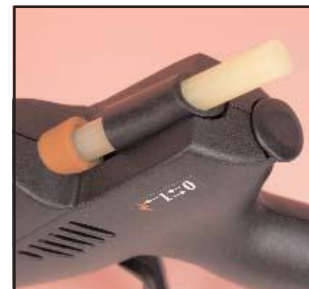
Allumage piezo et chargement facile