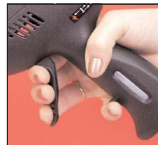
Gâchette souple à l'emploi et poignée bien en main