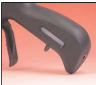
Réservoir gaz à remplissage rapide avec soupape de sécurité et fenêtre de niveau gaz