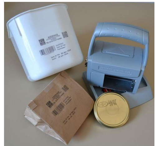
Exemples de marquage sur supports poreux et non poreux.